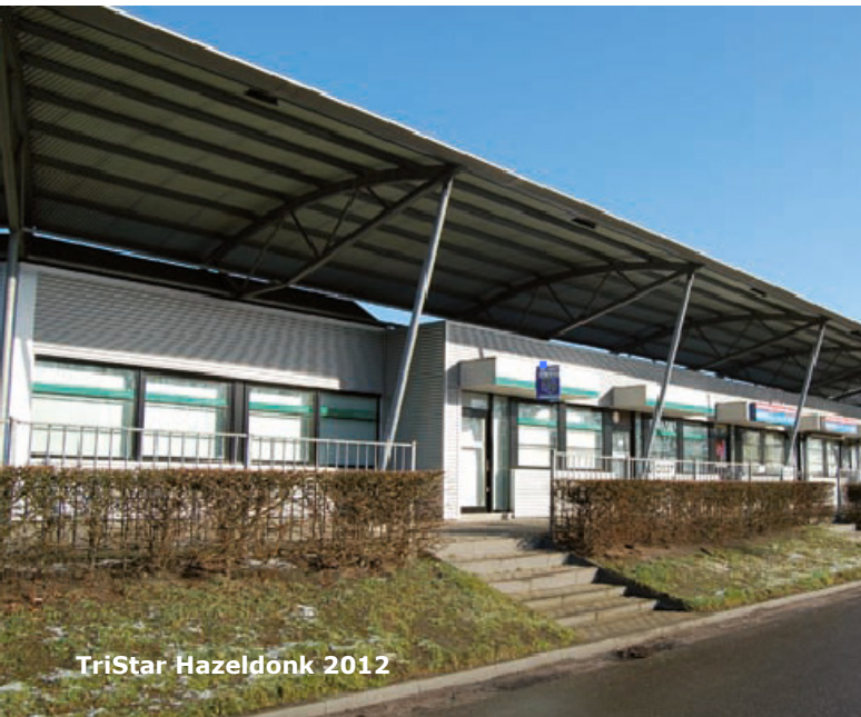
TriStar Hazeldonk 2012